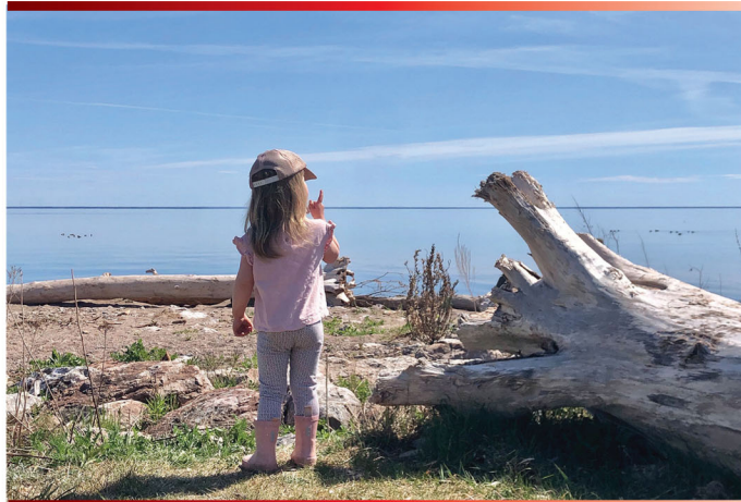
Circuit des plages : Plage Fauvel

d'adaptation et je vous remercie d'avance pour votre collaboration.