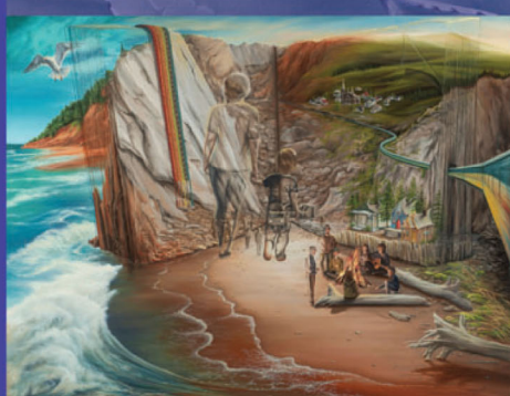
Page d'histoire - Manon Potvin

museeacadien.com facebook/museeacadienduquebec