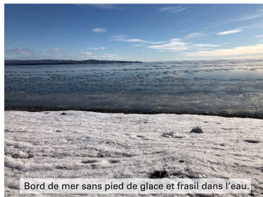
Bord de mer sans pied de glace et frasil dans l'eau.

Carleton-sur-Mer Maria New Richmond Bonaventure