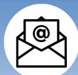
Abonnement à l'infolettre