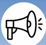
Système d'alerte à la population