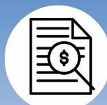
Compte de taxes en ligne

Abonnez-vous dès aujourd'hui: villebonaventure.ca Assistance technique : 418 534-2313, poste 222