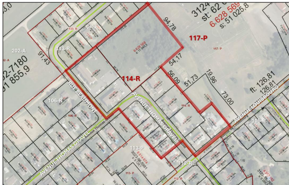
Croquis 2 : Limites des zones 114-R et 117-P – Après la modification