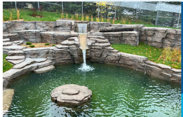
Photo de couverture : Pavillon Desjardins. Ci-haut : passerelle dans l'habitat renouvelé de la toundra. Ci-bas : nouvel habitat des loutres.